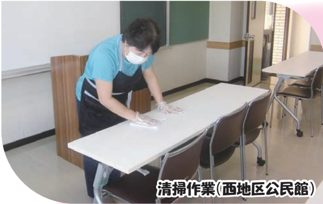
清掃作業(西地区公民館)