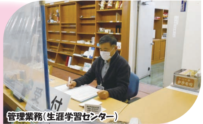
管理業務(生涯学習センター)