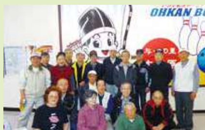
ボウリング同好会